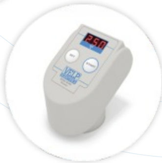
VELP BOD Carência Bioquímica de Oxigénio