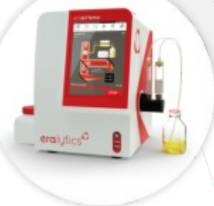
ERAJET FAME Analizador FTIR de contaminantes FAME