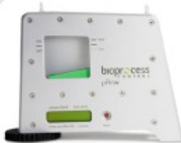
µFlow Contador de Gás