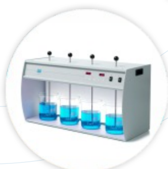
VELP JLT Floculador