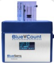
BlueVCount Contador de Gás