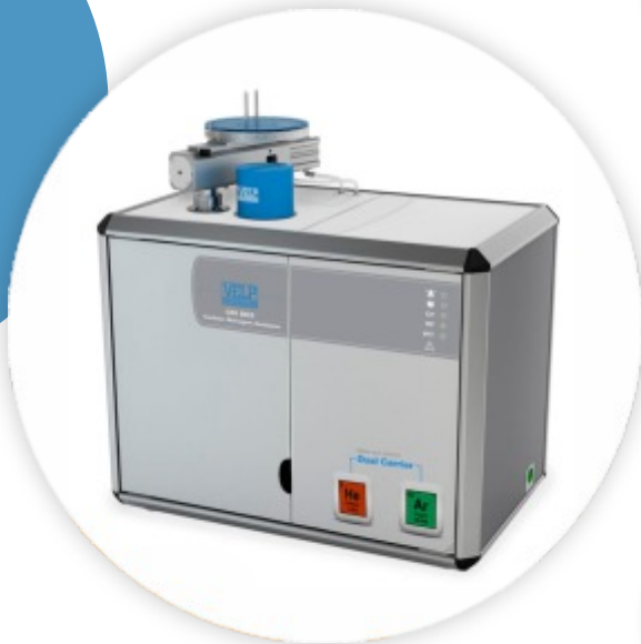
VELP CN802 Analisador Elementar