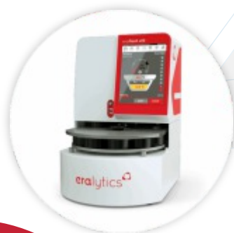
ERAFLASH Analizador de Flash Point