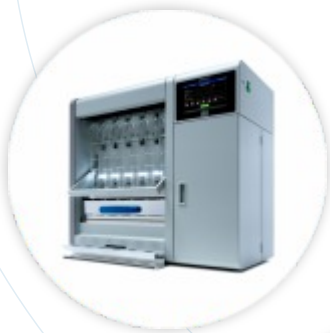
VELP FIWE A Extrator de Fibras