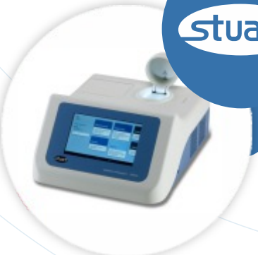
SMP50 Medidor de Ponto de Fusão