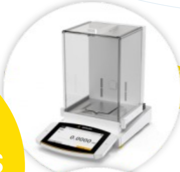
Cubis® II Balança Analítica