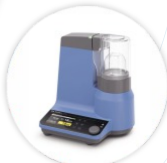
MultiDrive control MT Moinho