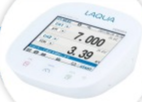
F-73 Medidor Multiparamétrico de Bancada