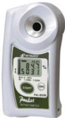
PAL Refratómetro Digital Portátil