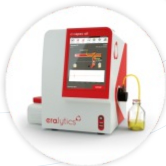
ERASPEC OIL Analizador FTIR da condição de óleos