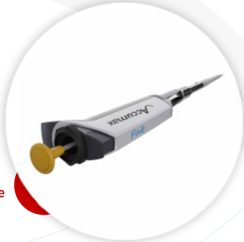
FAB Pipette Micropipeta