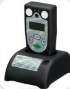
Rivelgas Detetor de gás