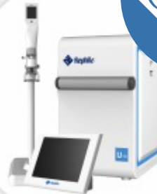
Genie PURIST Sistema de Purificação de Água