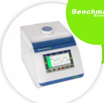
TC 9639 Termociclador