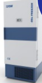
FDM -80°C Ultrafrio