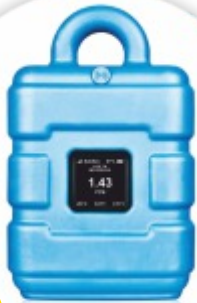
myDatasens H2S Datalogger de H2S