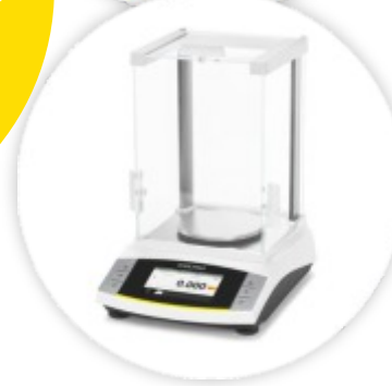
Entris® II Balança Analítica