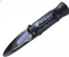
Master Refratómetro Analógico Portátil