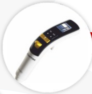
Electronic Pipette Micropipeta Eletrónica