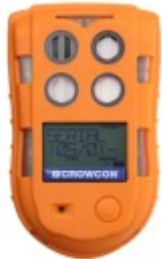
T4 Detetor de Gases Portátil