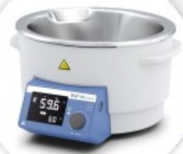
HB digital Banho de Aquecimento