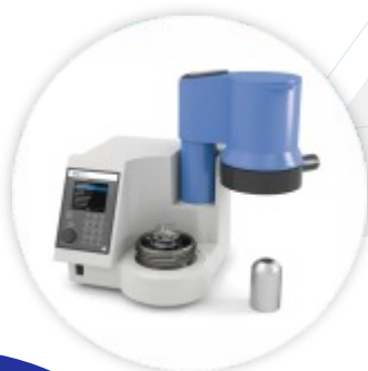
C 1 Package 3/10 Calorímetro