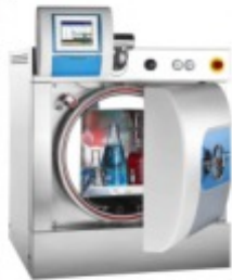
FOB Autoclave de Bancada