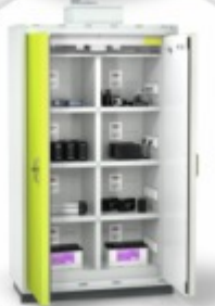
BATTERY LINE Armário de Segurança para para Baterias