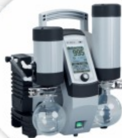
ME 4C NT +2AK Sistema de Vácuo