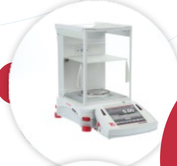
Explorer® Semi-Micro Balança Semi-Micro