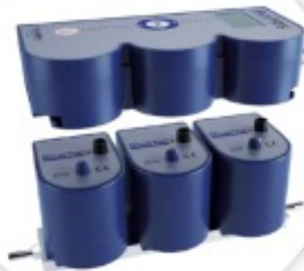
BlueVary Analisador de Gás