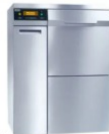
PG 8504 Máquina de Lavar