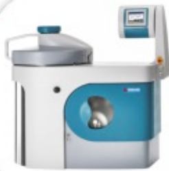
FVA/A1 Autoclave Vertical