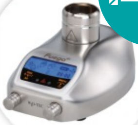
Fuego SCS Bico de Bunsen