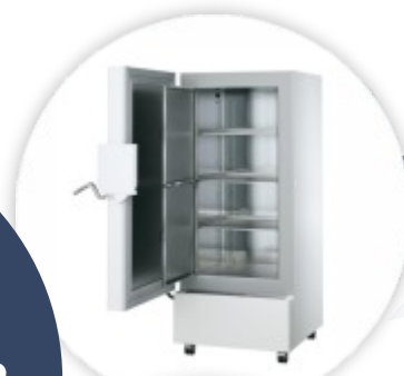
SUFsg 5001 Ultrafrío