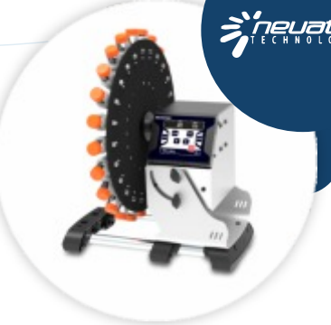
iRoll Dr24 Agitador de Tubos