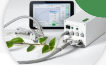
PAM 2500 Medidor de Clorofila