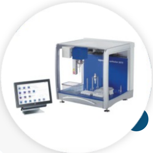
epMotion® 5073l Sistema para manuseamento de líquidos