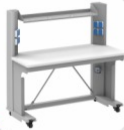
SKYLAB Bancada para Laboratório