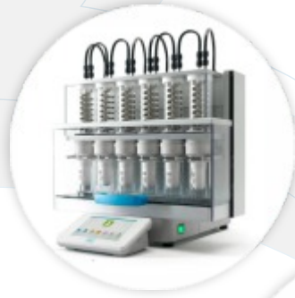
VELP SER158 Extrator de Gorduras