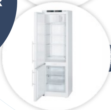
Lcexv 4010 Frigorífico