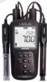
LAQUA 200 Medidor Multiparamétrico Portátil