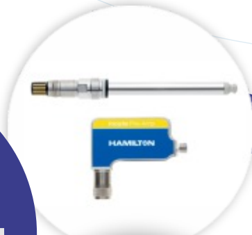
Incyte Arc 120 Sonda para Densidade Celular