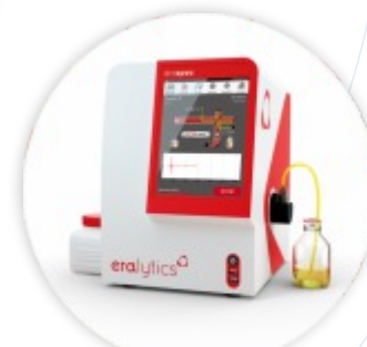
ERASPEC Analizador FTIR de Combustíveis