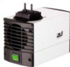
LABOPORT® UN 86 KTP Bomba de Vácuo