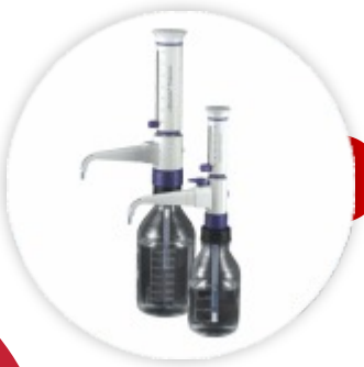
Bottle Top Dispenser Dispensador