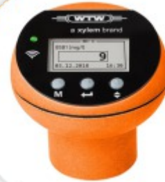
Quantum Fotodocumentação de Gel