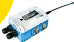
myDatalogEASY V3 Datalogger com GSM