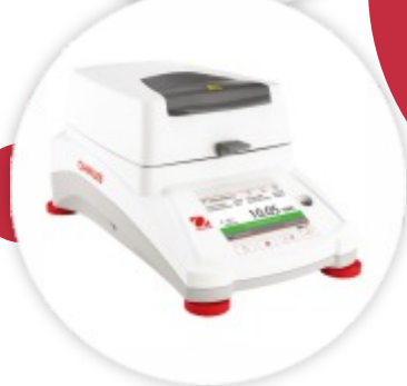
Mb120 Balança de Humidade