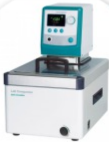
CW3-30P Banho com Circulação