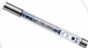
DOM-24 Analisador da Qualidade do Óleo