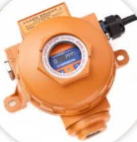
Xgard Bright Detetor de Gases Fixo