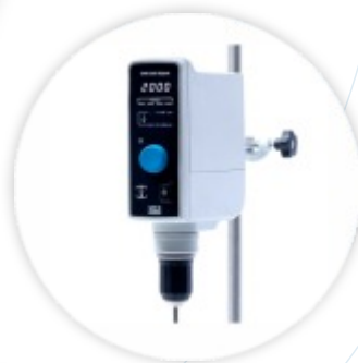
VELP OHS-200A Agitador Vertical