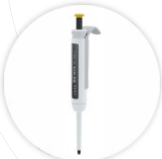
Pette vario Micropipeta