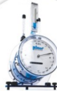
TG Contador de Gás