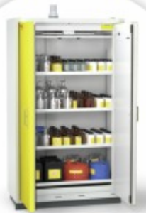
CLASSIC LINE Armário de Segurança para Químicos