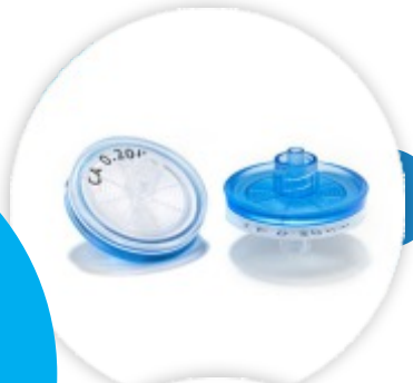
ABLUO® 33 mm Filtros para Seringa