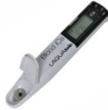
LAQUA iCa Medidor de Cálcio no Sangue Bovino