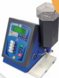
BWB XP Fotómetro de Chama