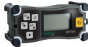
Metrex Detetor de gás