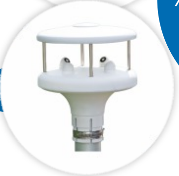
Levellogger® 5 Medidor de Nivel