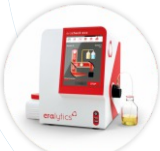
ERACHECK ECO Analizador de Óleos e Gorduras em Água