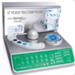
easySpiral Inoculador Automático