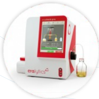
ERACHECK PRO Analizador de Óleos e Gorduras em Água