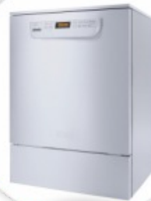
PG 8583 Máquina de Lavar