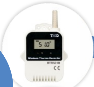
RTR501BL Data Logger