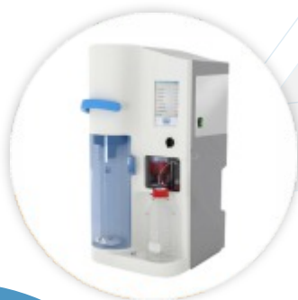
VELP UDK169 Destilador de Azotos