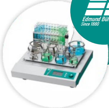
Compact Shaker KS 15 A control Agitador Orbital