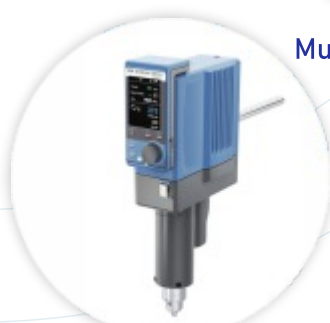
STARVISC 200-2.5 Viscosímetro