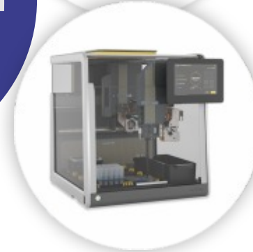
Microlab Prep Sistema de Manuseamento de Líquidos