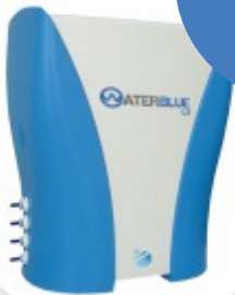
Waterblue Sistema de Purificação de Água