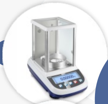
ALS-A/ALJ-A Balança Analítica