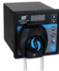
Tubos Tubos para Bombas Peristálticas