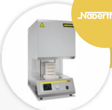
LHT 03/17 D Mufla