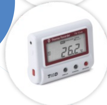
TR-72wb-S Data Logger