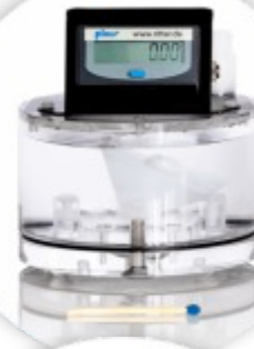
MGC Contador de Gás