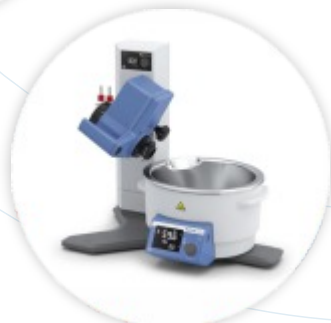
RV 8 FLEX Evaporador Rotativo