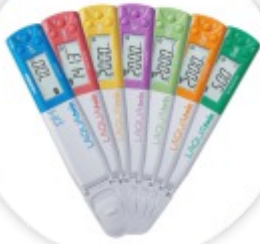
LAQUAtwin Medidor de Bolso