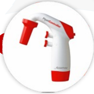
Pipette controller Pipetador