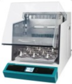
IST-3075 Agitador Orbital com Incubação